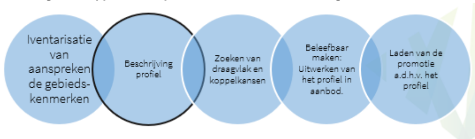
Afbeelding 5.2 Stappen in het profileren van een bestemming