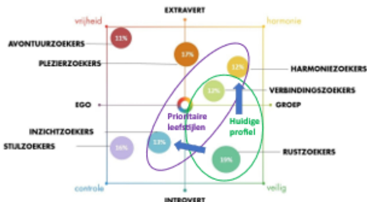
Figuur 5.1: Prioritaire leefstijlen voor Bergen

Prioritaire leefstijlen zijn inzichtzoeker, verbindingszoeker en harmoniezoeker. Voor de omgeving Leukermeer geldt dat de stijlzoeker en plezierzoeker centraal staan. Zij worden in dit gebied ook goed gefaciliteerd.