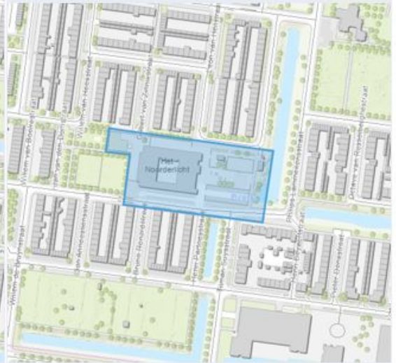
Noorderlichtplein en aangrenzende parkeerzones (Geeren-Noord)