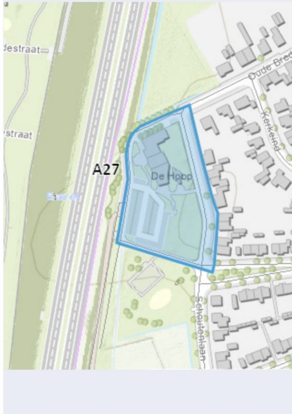
Molen De Hoop (Bavel)