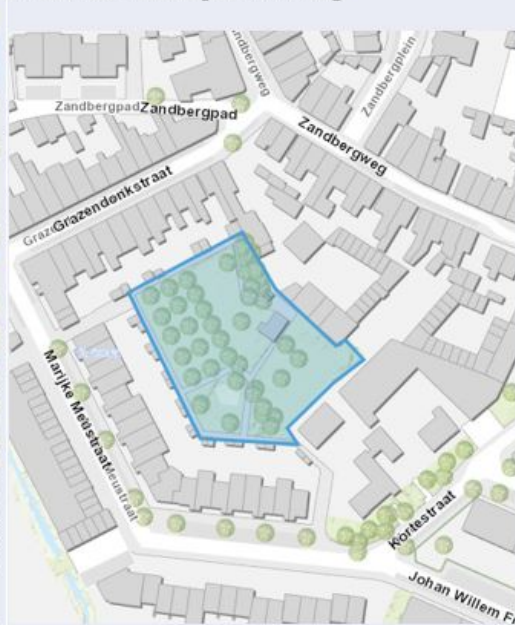
Dierenweide park Overbos (Prinsenbeek)