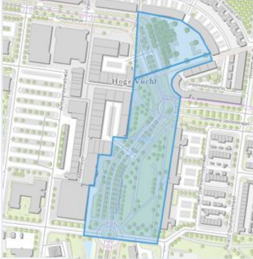
Groenedijkplein en grasveld deel Doornboslaan (Geeren- Noord/Zuid)