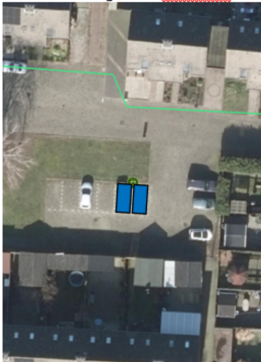
Locatie ter hoogte van Venkelhof 7