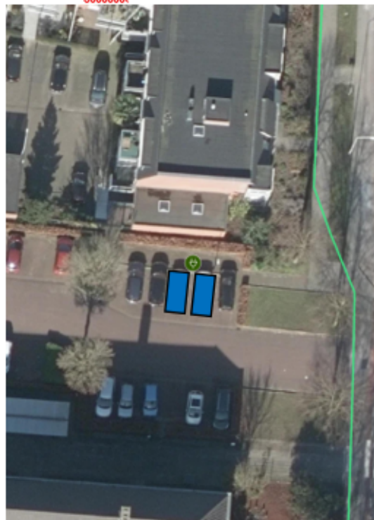
Locatie t.h.v. Laan ten Roode 24A