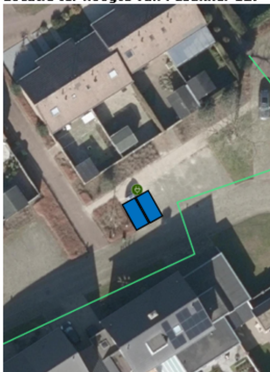
Locatie ter hoogte van Pasakker 127