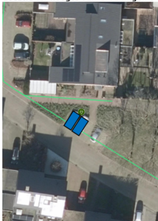
Locatie ter hoogte van Groeningen 9