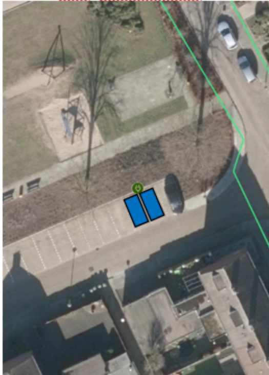
Locatie t.h.v. Bosselerstraat 29