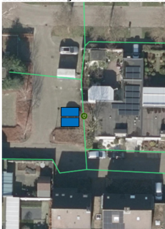
Locatie ter hoogte van Voorbeemd 24