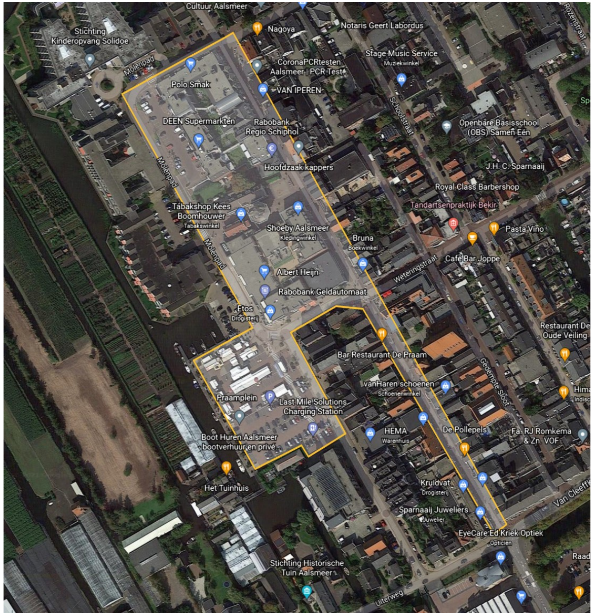
Centrum 2 Aalsmeer