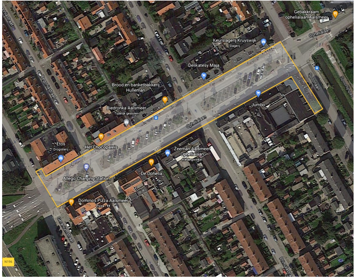
Centrum 4 Aalsmeer