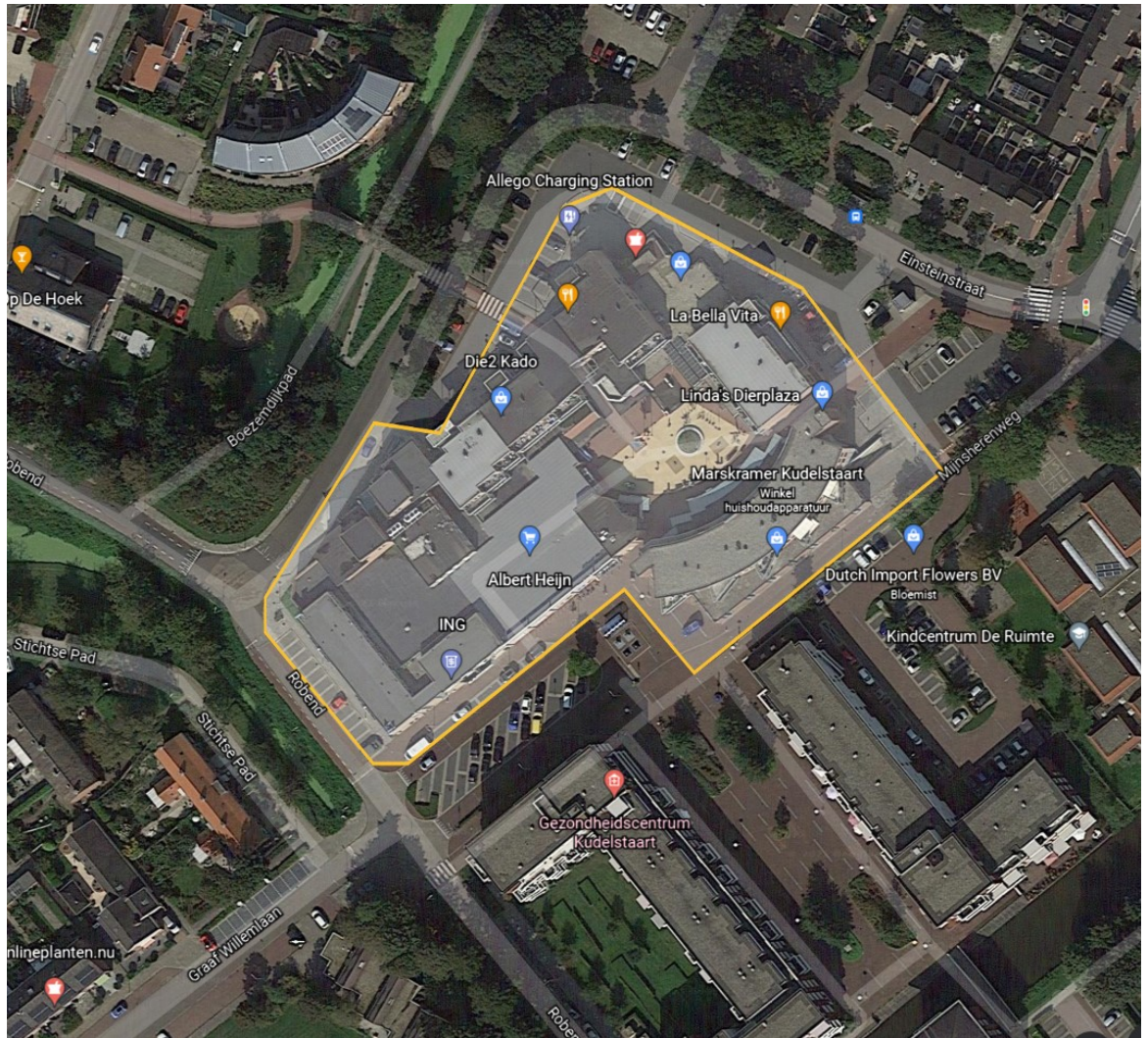
Centrum 1 Aalsmeer