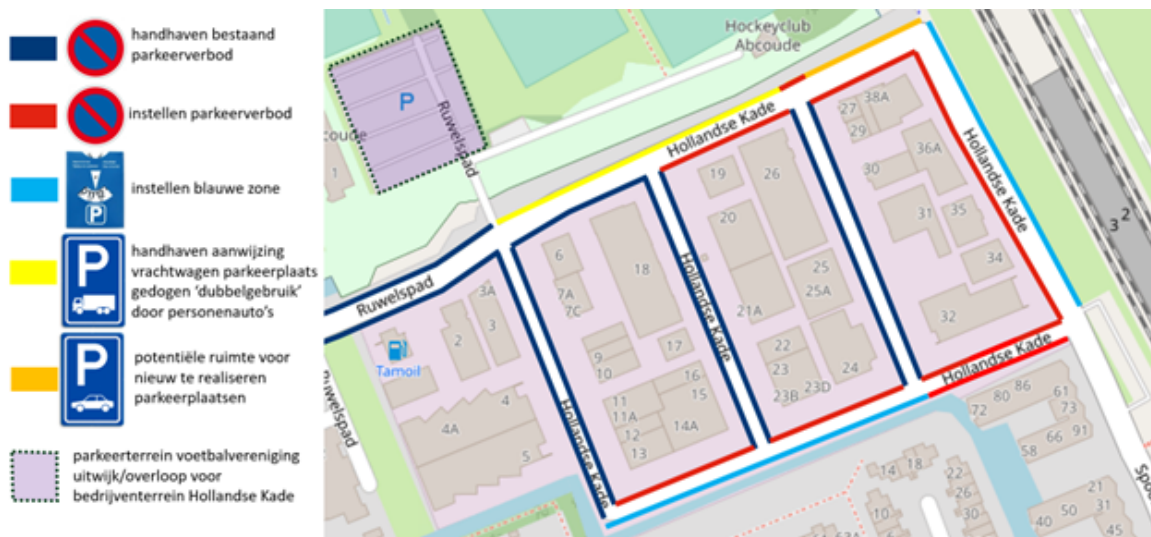
Woonstraten Fluitekruid e.o.