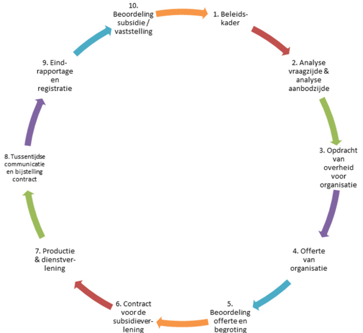
Figuur 2 Beleidscyclus beleidsgestuurde contractfinanciering

De beleidscyclus van BCF ziet er als volgt uit (zie figuur 2). 1 Uit het schema blijkt dat de cyclus start met het vaststellen van het beleidskader waarin de te bereiken maatschappelijke doelen zijn omschreven. Na analyse van het aanbod dat maatschappelijke instellingen kunnen doen vindt de uitvraag plaats en dient de instelling een subsidieaanvraag in, in de vorm van een offerte. Na beoordeling door de gemeente leidt dit tot een subsidieovereenkomst (contract) met de instelling om de vooraf overeengekomen activiteiten of prestaties uit te voeren, dat door de opdrachtgever gestelde doelen worden bereikt.