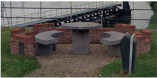
Locatie Brugdijk Vianen