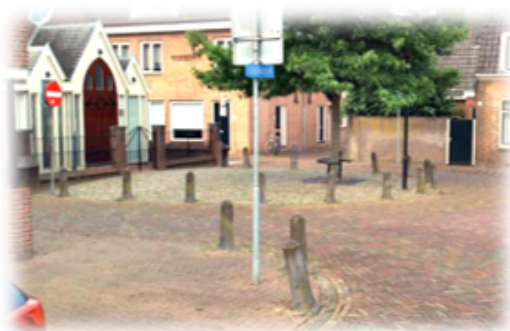
Locatie Schoolstraat Vianen

In de gemeente staan in totaal 7574 palen van diverse types. Uit de inventarisatie is gebleken dat veel afzetpaaltjes staan op locaties waar niet direct een afzetpaal noodzakelijk is. Veel paaltjes staan echter wel met een reden, bijvoorbeeld om parkeren tegen te gaan of om te voorkomen dat een bocht wordt afgesneden.