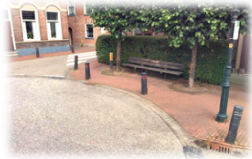
Locatie Dorpsplein Meerkerk

Afzetzpalen zijn obstakels en in het kader van een toegankelijk openbare ruimte is het gewenst om zo min mogelijk obstakels te hebben. Om deze reden zal bij elke vervanging of aanleiding bekeken worden of het afzetzpaaltje nog wel noodzakelijk is. Aanvullend hierop zijn de afzetzpalen gevoelig voor schade waardoor de beeldkwaliteit B veelal niet gehaald wordt en de gemeente met hoge vervangingskosten wordt geconfronteerd.