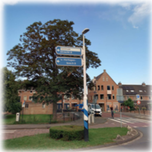
NBD wegwijzer autoverkeer Locatie Aime Bonnastraat Vianen

De NBD maakt plannen voor alle borden die verwijzen naar geografische bestemmingen en behoren tot het regionale en/of landelijke systeem van verwijzingen: de blauwe borden met witte letters (autoverkeer) en de witte borden met rode letters (fietsverkeer).