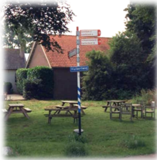
NBD wegwijzer fietsverkeer Locatie Huibertweg Hei en Boeicop

Volgens artikel 153a van de Wegenverkeerswet betaalt elke gemeente een vaste bijdrage per bewegwijzeringobject aan de NBD voor het beheer. Het tarief is vastgesteld op € 22,50 per bewegwijzeringobject. In de gemeente Vijfheerenlanden staan 160 bewegwijzeringobjecten.