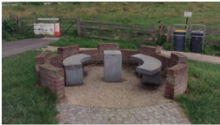
Locatie Haven Lexmond

In de gemeente Vijfheerenlanden bevinden zich ook 2 stuks speciale zit gelegenheden. De kosten voor het beheer en onderhoud van deze objecten zijn minimaal.