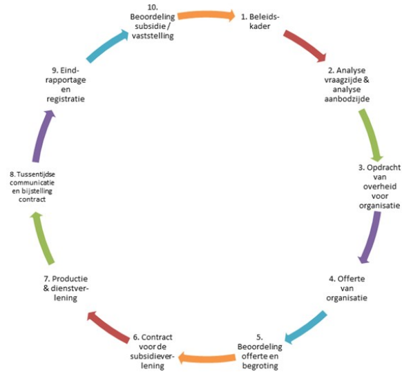
Figuur 2 Beleidscyclus beleidsgestuurde contractfinanciering

Per kwartaal vindt er overleg plaats met de instelling en dat kan een reden zijn om de subsidieovereenkomst aan te passen, bijvoorbeeld aan nieuwe ontwikkelingen. De cyclus eindigt met het opleveren van een eindrapportage door de instelling en de beoordeling en vaststelling van de subsidie. Dit vormt tevens de input voor een eventuele nieuwe subsidie voor een eventuele volgende subsidieperiode en zo nodig het bijstellen van beleid.