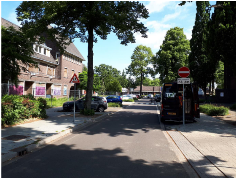
Geldersestraat t.h.v. Gelderhof

Plaatsen bord E2 met onderbord "schooldagen 8-16h" aan weerszijden van de weg