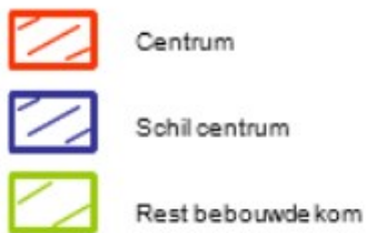
Figuur 3.2 Gebiedsindeling gemeente Valkenswaard