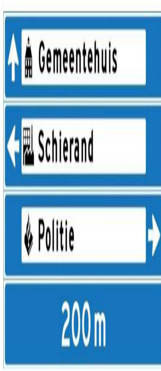
Figuur 1 voorbeeld borden publieke voorzieningen