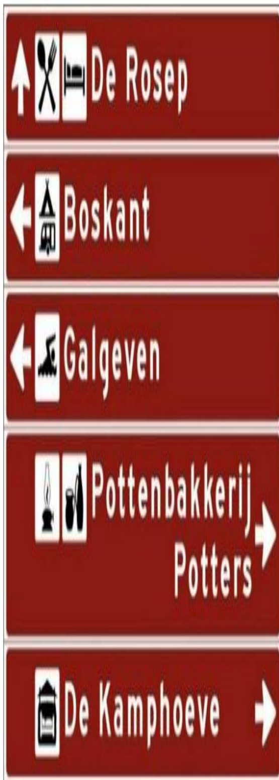
Figuur 2 voorbeeld borden toeristisch-recreatief