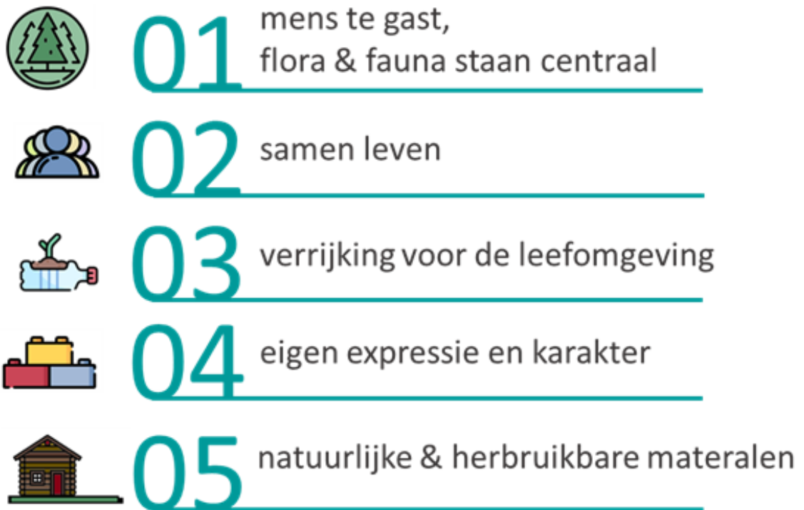
Figuur 1 stedenbouwkundige en architectonische uitgangspunten

Voor de ruimtelijke invulling van pilotlocaties dient er van uitgegaan te worden van de uitgangspunten in deze paragraaf (figuur 1). Detailuitwerking is afhankelijk van de locatie mogelijk op basis van de ruimtelijke kwaliteiten van de locatie.