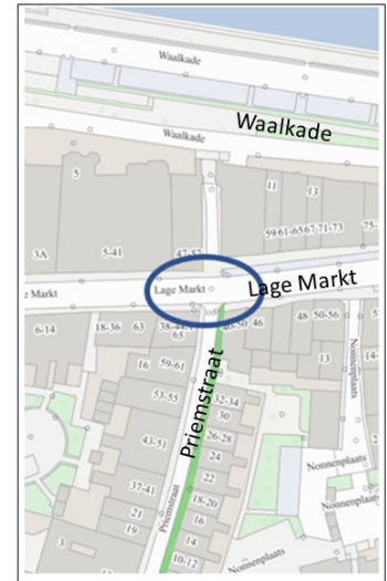
Lage Markt-Priemstraat; stopverbod tekening 04-07-2022