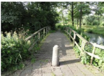
Foto 4: Het dek is overgroeid met grassen en diverse dekdelen zijn gespleten. Het dek heeft een onverzorgde aanblik en vormt op korte termijn een risico voor de veiligheid.