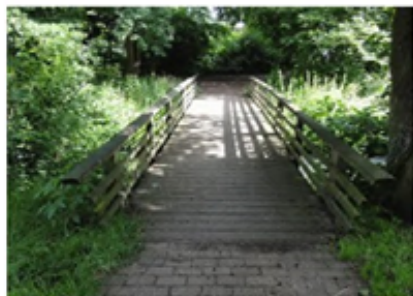
Foto 3: Plaatselijk is begroeiing geconstateerd en zijn enkele dekdelen licht aangetast door houtrot. Het dek voldoet nog aan zijn functie en ziet er redelijk verzorgd uit.