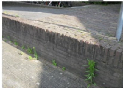
Foto 1: Plaatselijk zijn stenen beschadigd. De functie en de duurzaamheid zijn nog niet in het geding