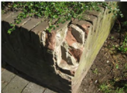
Foto 2: Stenen zijn structureel beschadigd en afgebroken. De duurzaamheid is in het geding