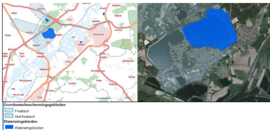
Waterwin- en grondwaterbeschermingsgebied

In de gemeente Maasgouw zijn twee drinkwateronttrekkingsgebieden van Waterleidingmaatschappij Limburg (WML) met daar omheen een grondwaterbeschermingsgebied. Dit zijn de Lange Vlieter bij Heel en het grondwaterpompstation bij Beegden. De woonkernen van Beegden en Heel liggen in of tegen het grondwaterbeschermingsgebied. Dit geeft beperkingen met betrekking tot infiltratie. Het kan zelfs zijn dat de Provincie goedkeuring moet geven aan afkoppelplannen of vergunningaanvragen kan weigeren.