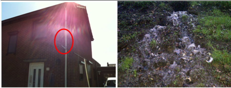
Links: vuilwaterriool op regenpijp, Maasbracht | Rechts: vervuiling op Vlootbeek.