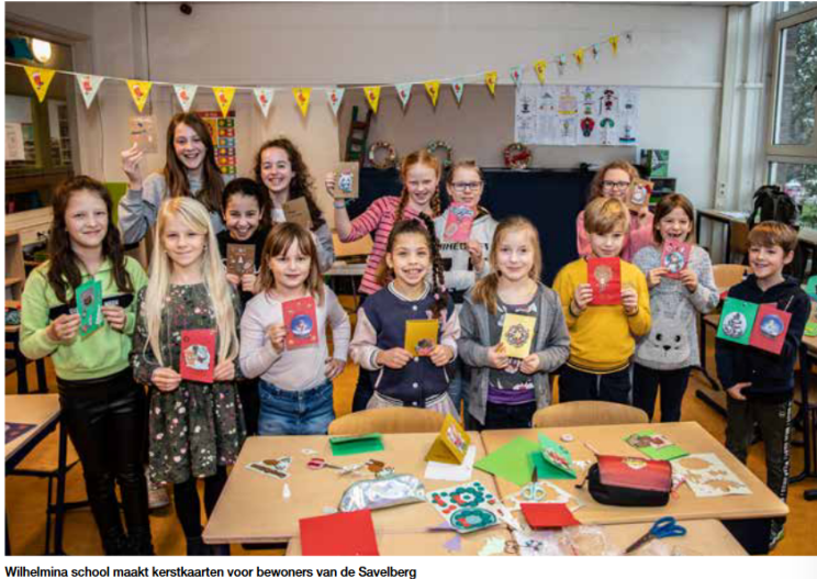
Wilhelmina school maakt kerstkaarten voor bewoners van de Savelberg

‘Ondersteuning gericht op optimale deelname op school, op de arbeidsmarkt, thuis, op de club of vereniging in de buurt.’