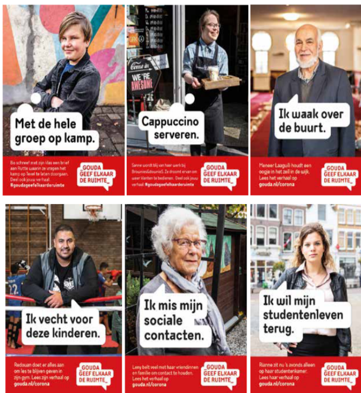
Diversiteit zichtbaar in de coronacampagne

Het gebruik van stockfoto's heeft het nadeel dat de beelden niet herkenbaar zijn als Gouds.