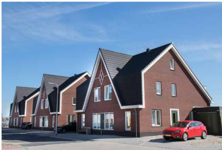
De wijk Westergouwe is rolstoelvriendelijk gebouwd