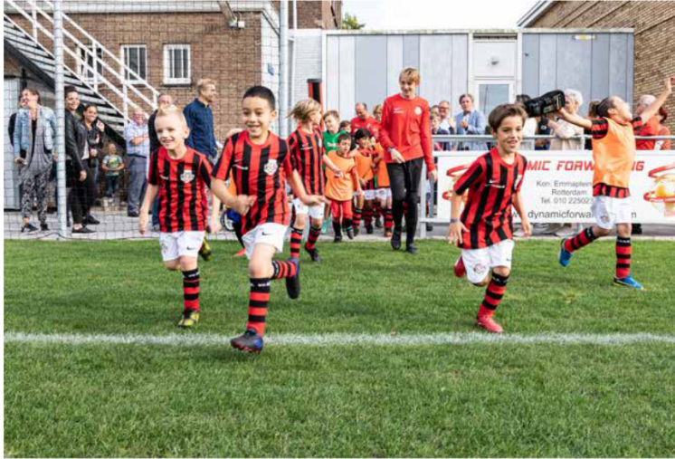
Gouds sportveld ona met diverse sportende kinderen

'Meedoen in reguliere clubs & verenigingen is vanzelfsprekend. Er zijn geen fysieke, sociale of financiële belemmeringen meer.'