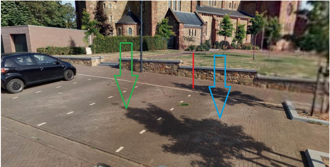
Afbeelding 1: locatie laadpaal en parkeervak dat gereserveerd wordt voor elektrische voertuigen (foto)