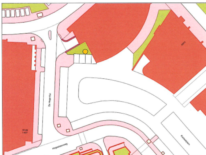
Tekening Verkeersbesluit 1702130 Kasteelplein