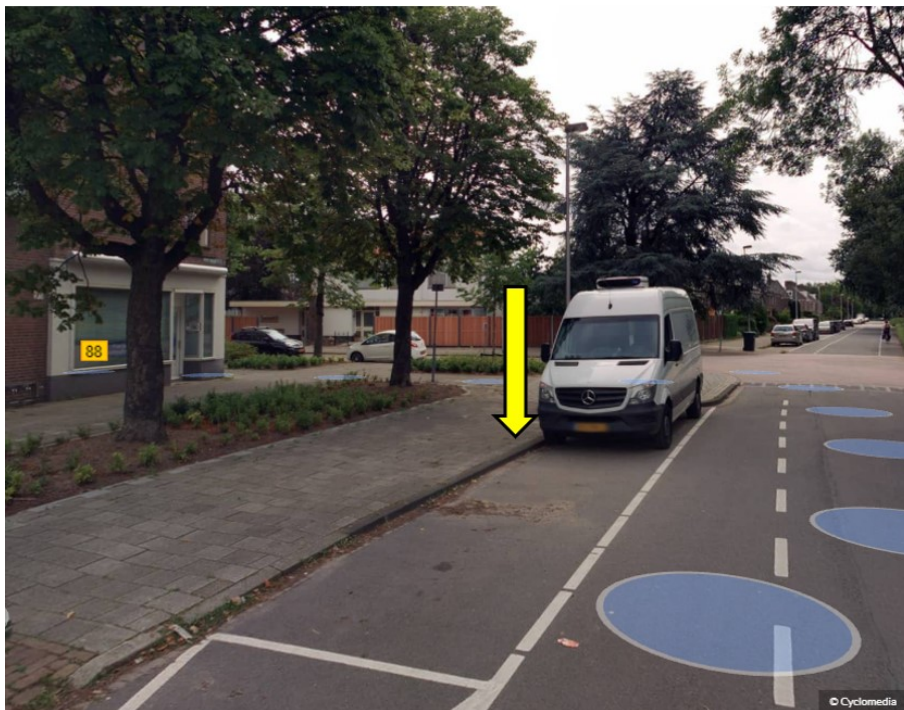
Geert Grootestraat t.h.v. 27