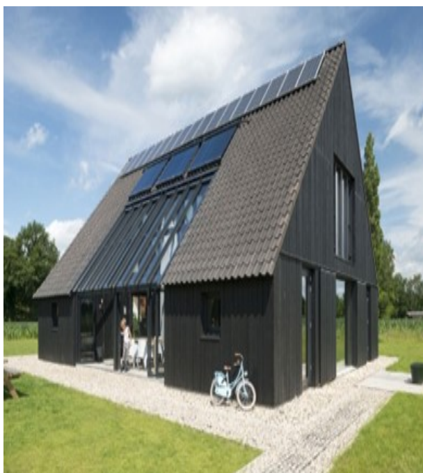
Extra variatie: Dakvlak (deels) van glas