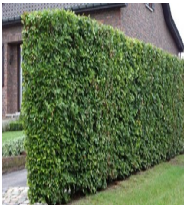
ROOD: Beukenhaag 180cm langs zij- en achterzijden kavels