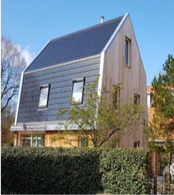
Mansardedak met zonnepanelen