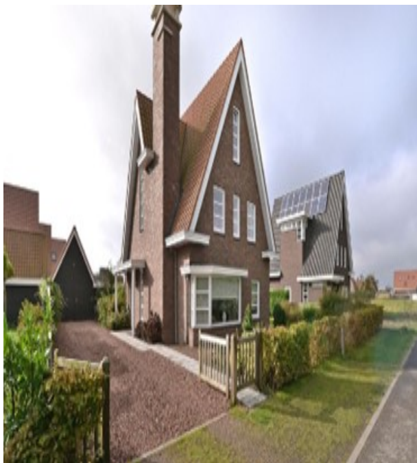
2. Vrijstaande woningen langs de Schapendrift