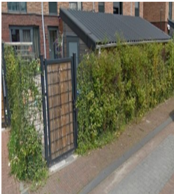
ROOD: Hekwerk met gemengde klimplanten