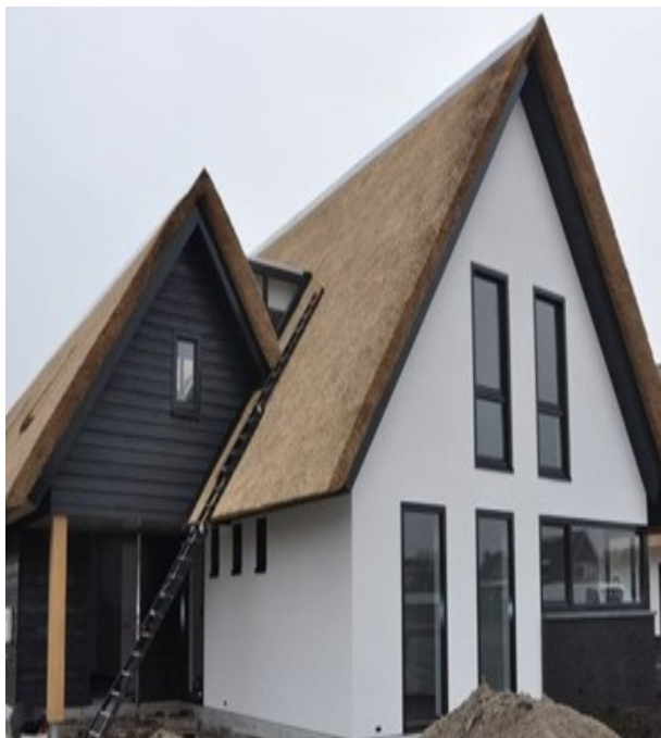
Extra variatie: Brede dakoverstekken - rieten dak