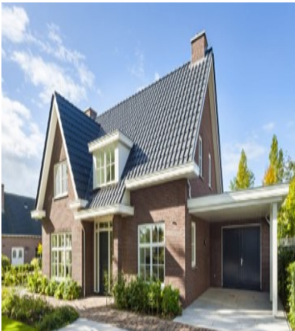
Accent door wisseling in kaprichting mogelijk