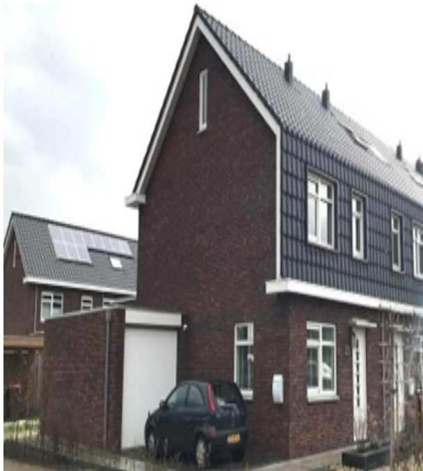
1. 2 e 1 kap woningen langs de Schapendrift