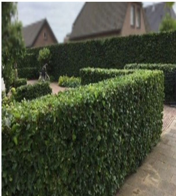
BLAUW: Beukenhaag 120cm langs voorzijden kavels