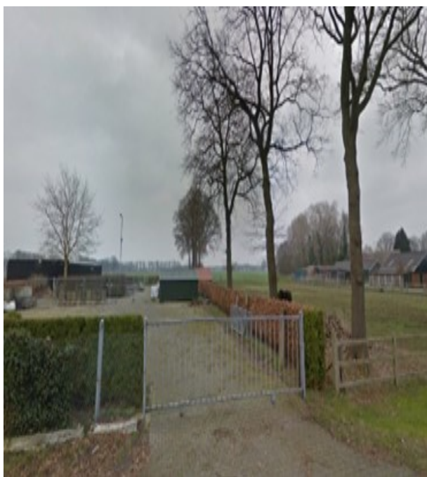
GROEN: Bestaande beukenhaag langs erfgrans