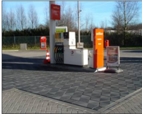
Tabel: wel of geen onderzoek bij vloeren