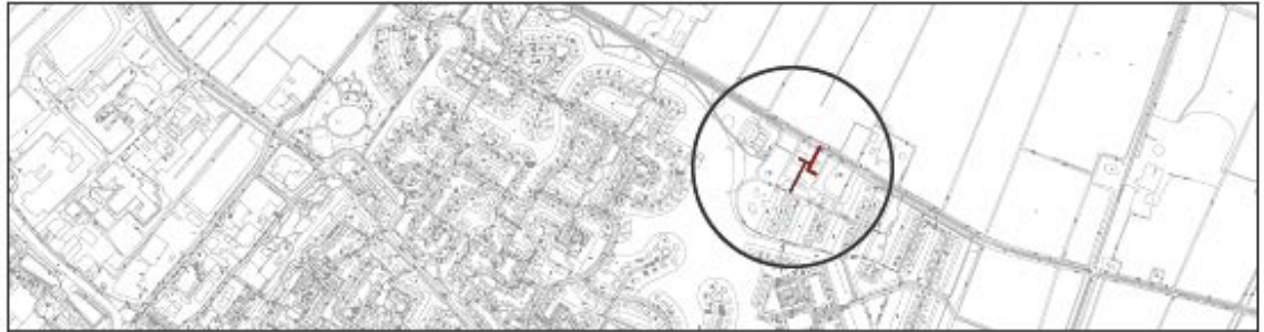
Situatie schaal n.v.t