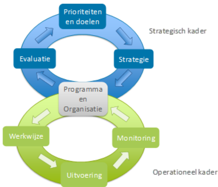
Figuur 1: 'Big 8' geeft de samenhang weer tussen prioriteiten, doelen en uitvoering.

Onderstaande figuur (de Big Eight ) geeft de planvorming en uitvoering weer op het vlak van toezicht en handhaving met doelen en prioriteiten op strategisch niveau (opgenomen in de beleidsnota toezicht en handhaving) en op programma- en operationeel niveau (in het HUP).