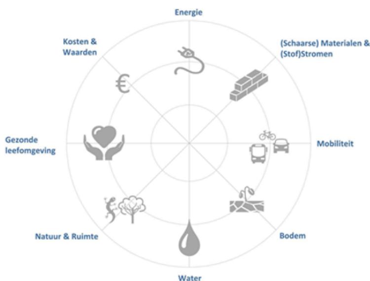
Figuur 2: Duurzaam ontwikkelen - Ambitieweb

Deze duurzaamheidselementen helpen om met alle betrokkenen in één oogopslag duurzame ambities helder te maken en deze gedurende het hele traject vast te houden en zo 'ambitie-erosie' te voorkomen. Het zorgt ervoor dat iedereen elkaar begrijpt en eenduidige termen hanteert.