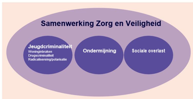
Schematische weergave van de Goudse veiligheidsprioriteiten