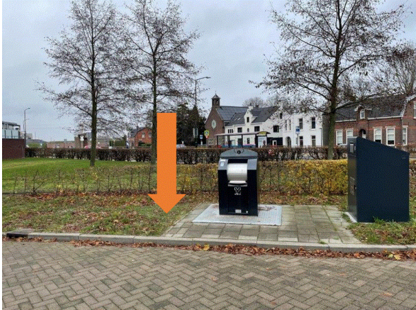
Extra PMD locatie aan de Zeldenrustlaan Restafvalcontainer vervangen voor een PMD-container.