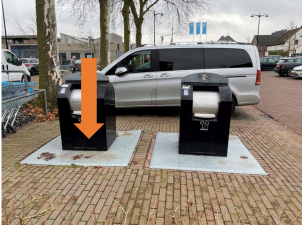
PMD 20 Theo van Delftstraat Nieuwe locatie ingraven naast bestaande restcontainer.