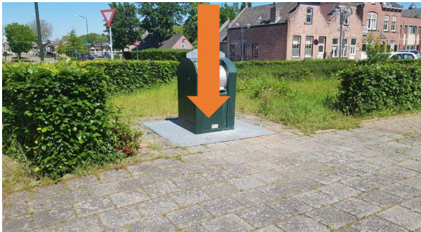
PMD 19 Rietaak Restafvalcontainer vervangen voor een PMD-container.