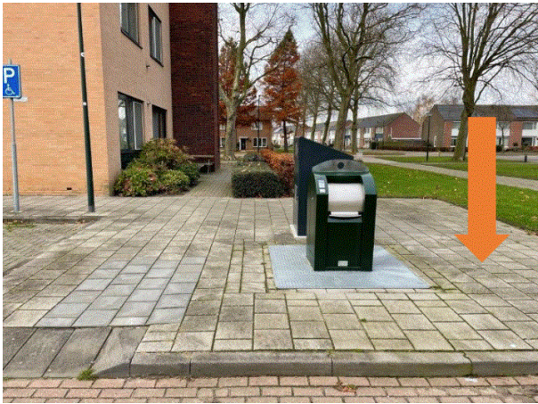
PMD 18 Grote kerkstraat Restafvalcontainer vervangen voor een PMD-container.