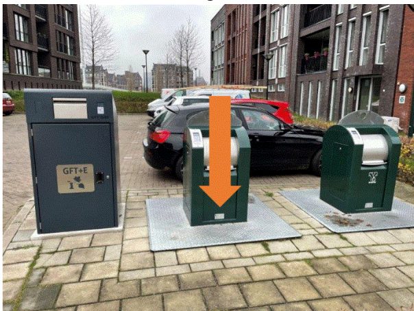
PMD 22 Spoordijk Nieuwe locatie ingraven naast bestaande restcontainer.