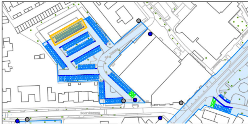
Figuur 2: in oranje weergegeven de op te heffen parkeerplaatsen De Smidse