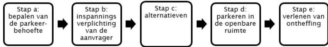
Figuur 1: Stroomschema bepalen van de parkeereis