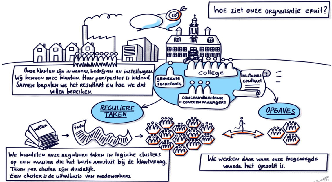
Figuur II: kaders organisatie