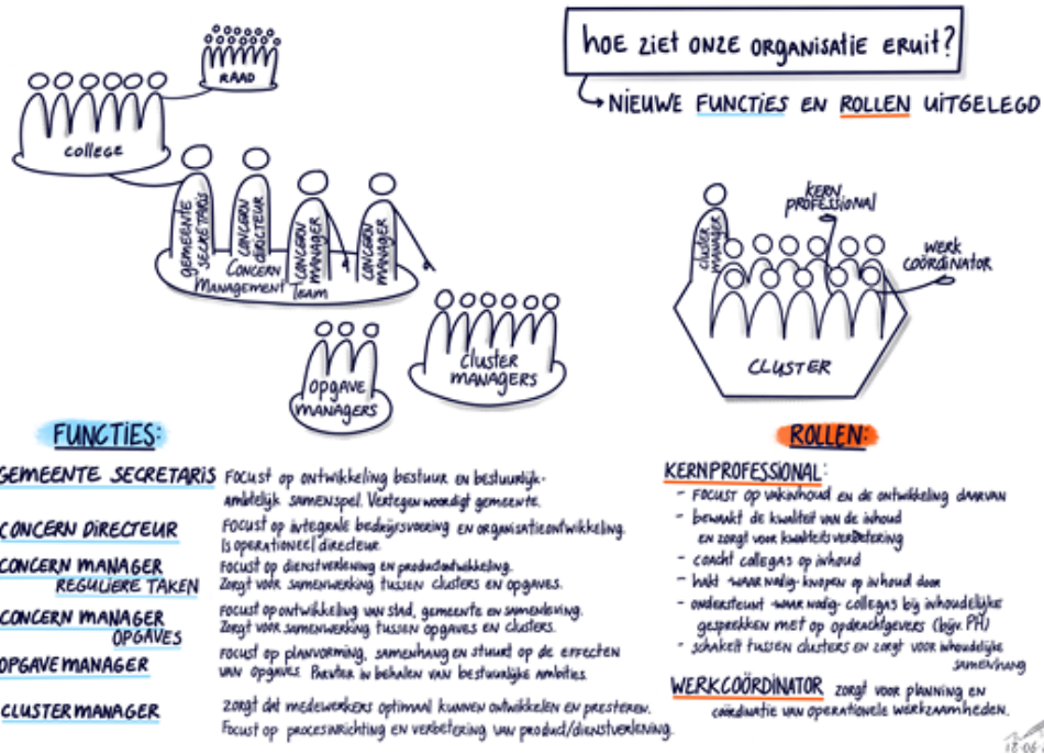
Figuur IV: Organogram