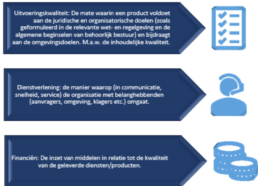
Figuur 6: Doelen uit Verordening kwaliteit VTH schematisch weergegeven

Hierna zijn de bovenstaande kwaliteitsdoelen verder uitgewerkt met bijbehorende indicatoren. Ook zijn er, indien mogelijk, streefwaarden opgenomen per beleidsdoel.