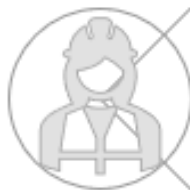
Figuur 5: Toelichting van de termen uit de Omgevingswet

Onder 'veilige' verstaan we de milieu- en bouwgerelateerde risico's, die mensen in hun fysieke leefomgeving lopen, zoals door het omgaan met en/of opslaan van gevaarlijke stoffen, en constructieve- en brandveiligheid. De doelstelling van veiligheid is het beperken van de milieu- en bouwgerelateerde risico's.