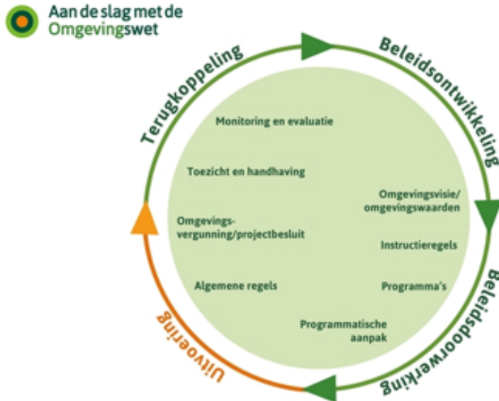
Figuur 2: Plan-do-check-act beleidscyclus Omgevingswet

De U&H-strategie legt het te voeren (kwaliteits-)niveau vast zoals vereist in de Omgevingswet en de kwaliteitscriteria 2.2. Elke gemeente en de provincie kan eigen bestuurlijke prioriteiten meegeven aan de omgevingsdiensten. Deze bestuurlijke prioriteiten krijgen plaats in het jaarlijkse uitvoeringsprogramma welke per deelnemer wordt vastgesteld.