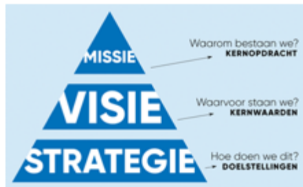
Figuur 3: Verhouding 'missie-visie-strategie'

Het uitgangspunt voor deze U&H-strategie is dat de missie het fundament onder de organisatie is. De visie beschrijft de manier waarop handen en voeten aan deze missie kan worden geven.