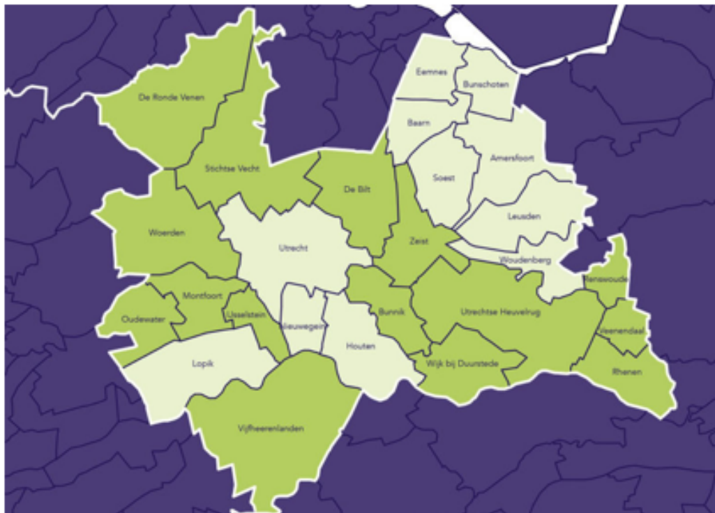
Figuur 4: Overzicht van het werkgebied van de omgevingsdiensten

Groen is het werkgebied van de ODRU; lichtgroen is het werkgebied van de RUD.