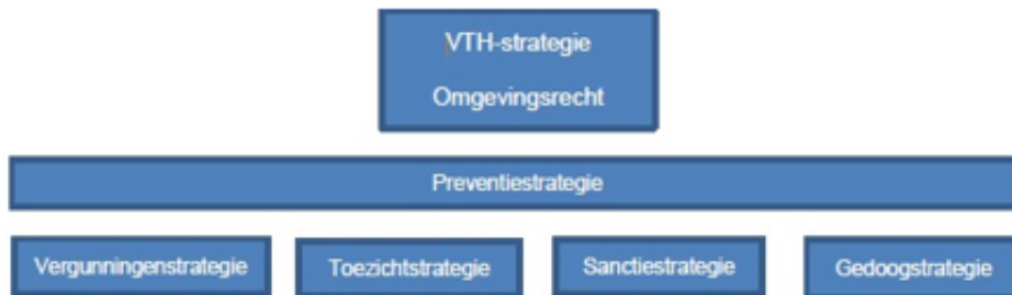
Figuur 7: onderlinge verhouding VTH-strategieën

In paragraaf 1.3 staat de BIG 8 cyclus beschreven. De strategieën zorgen voor een vertaling van het strategisch beleidskader naar het operationeel beleidskader.