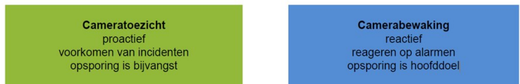
Figuur 2.1 Domeinen cameratoezicht en camerabewaking

Bij cameratoezicht ligt de nadruk op toezicht: er wordt ook naar de beelden gekeken als er geen incident gebeurt. Een belangrijk doel van cameratoezicht is het voorkomen van incidenten. Als zich een incident voordoet is het de bedoeling dat observanten in een meldkamer dit waarnemen en een directe reactie geven bijvoorbeeld door politie, toezichthouders of hulpverleners naar het incident toe te dirigeren, zodat vroegtijdig gehandeld kan worden.