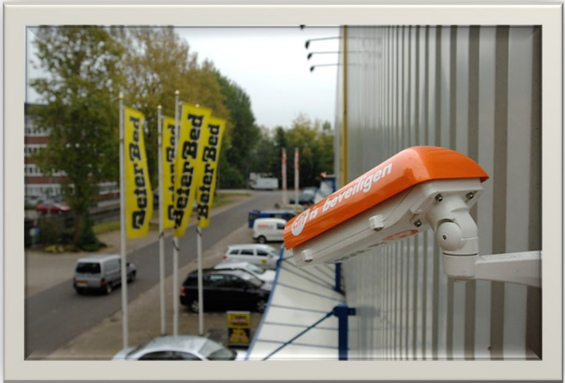
Beveiligingscamera's op het bedrijventerrein Goudse Poort 12 .

meldkamer van de politie, via een particuliere alarmcentrale of toezichtcentrale, de gelegenheid krijgt rechtstreek mee te kijken met de camerabeelden van bijvoorbeeld een winkel of winkelcentrum, wanneer een inbraak of overval (of andere gewelddadige delict) plaatsvindt.