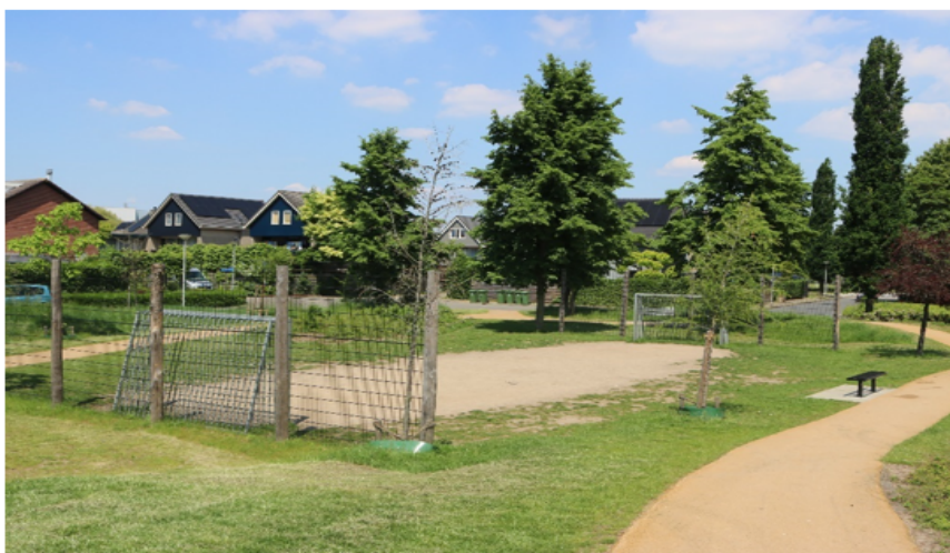
Speelplek met glooiende paden en voetbalveldje in Borculo