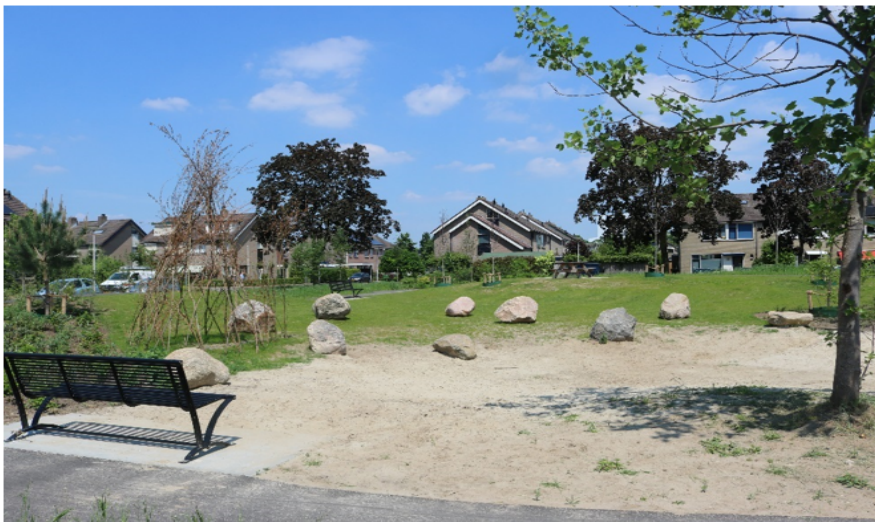
Foto: spelen en wadi gecombineerd in Borculo

Plekken om te bewegen en te spelen zijn vaak groenvoorzieningen met een bijzondere inrichting. Deze groenvoorziening kan plek bieden voor infiltratie van water, schaduw door middel van bomen, en een groene invulling met bloemen en bessen die aantrekkelijk zijn voor diverse dieren. In de ideale situatie wordt dit gecombineerd met speelwaarde. Bijvoorbeeld een wadi waar je ook in kan spelen, bloemen die je kunt plukken om te 'verkopen' in je speelhuisje, of een bosje waar je een hut in kunt maken. Alleen verharding waar nodig.