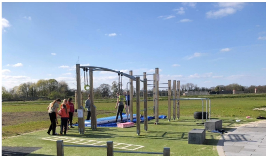
Foto: Voorbeeld van een buiten sport plek voor diverse spieroefeningen