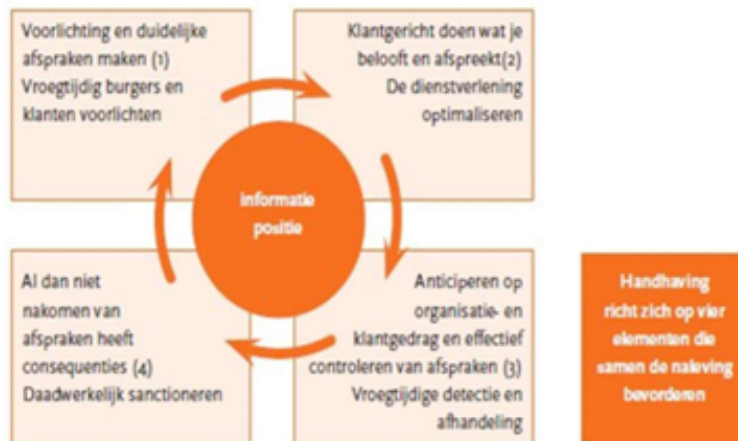
Figuur 2. Cirkel van naleving

Het uiteindelijke doel van handhaven is het bevorderen van de participatie en/of zelfredzaamheid van klanten in de samenleving en daarmee het draagvlak te behouden of te vermeerderen van onze inwoners. Twenteranders die een beroep doen op een voorziening worden geacht zelfredzaam te zijn en verantwoordelijkheid te nemen voor de naleving van de verplichtingen die hieraan verbonden zijn. Door voorzieningen effectief in te zetten kan de gemeente Twenterand daarbij helpen. Handhaving is nodig om de vertrouwensrelatie met de klant te versterken, de solidariteit van het sociaal stelsel te behouden en de (gemeente)gelden te beheersen.