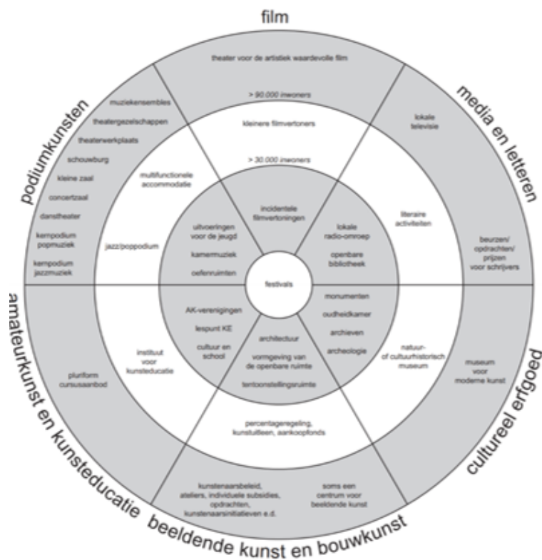
Figuur 1: VNG ringenmodel culturele infrastructuura

De Vereniging Nederlandse Gemeenten (VNG) heeft een ringenmodel (figuur 1) ontwikkeld om gemeenten handvatten te bieden bij het formuleren van gemeentelijk cultuurbeleid. Dit model deelt culturele voorzieningen en het bijbehorend cultuurbeleid in op basis van het inwonersaantal in drie ringen. Op basis van dit model kan een gemeente inschatten over welke culturele infrastructuur zij zou kunnen beschikken. Hoe groter de gemeente, hoe meer voorzieningen en hoe uitgebreider het beleid.