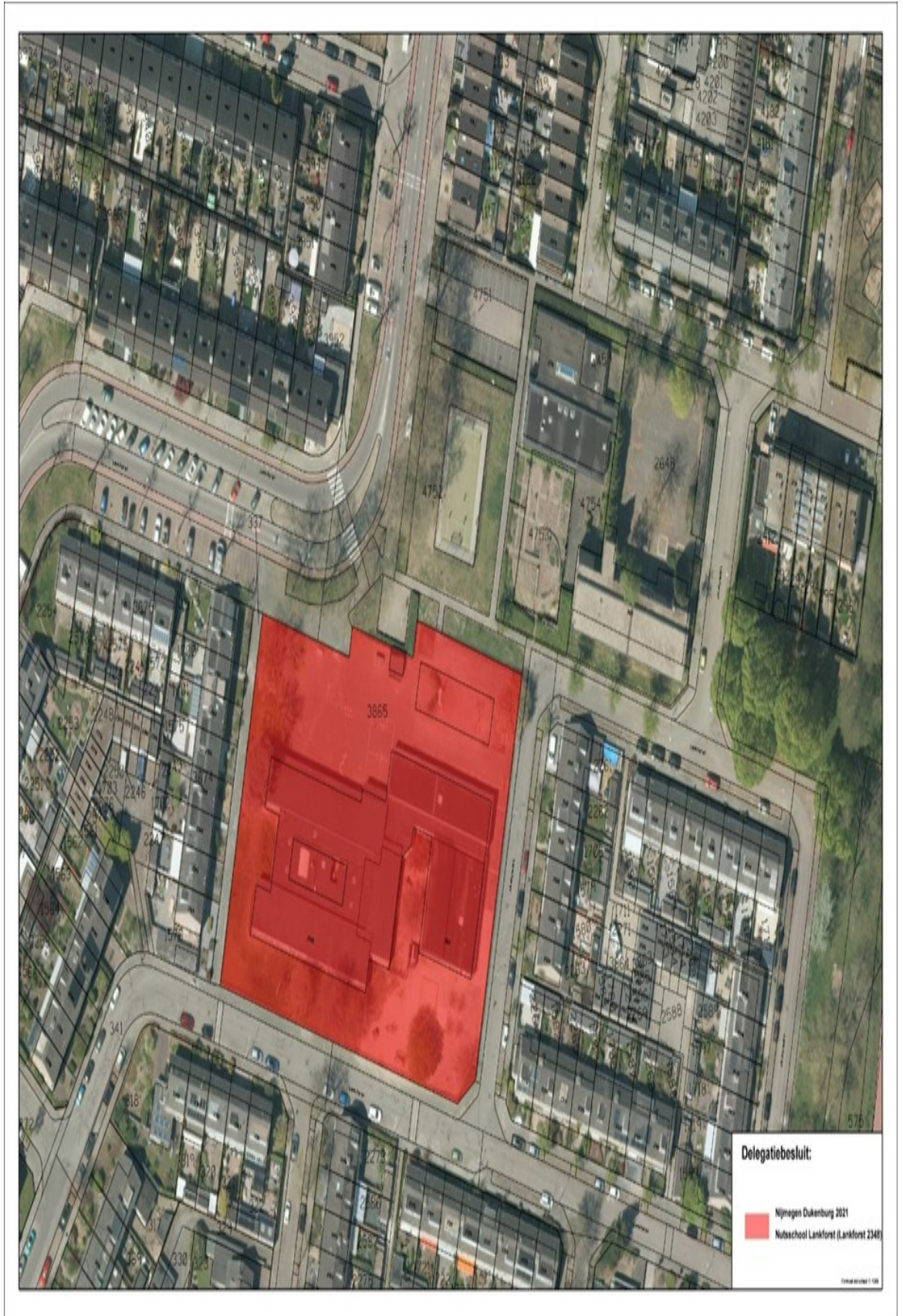
Bijlage 2: Zwanenveld 14e straat