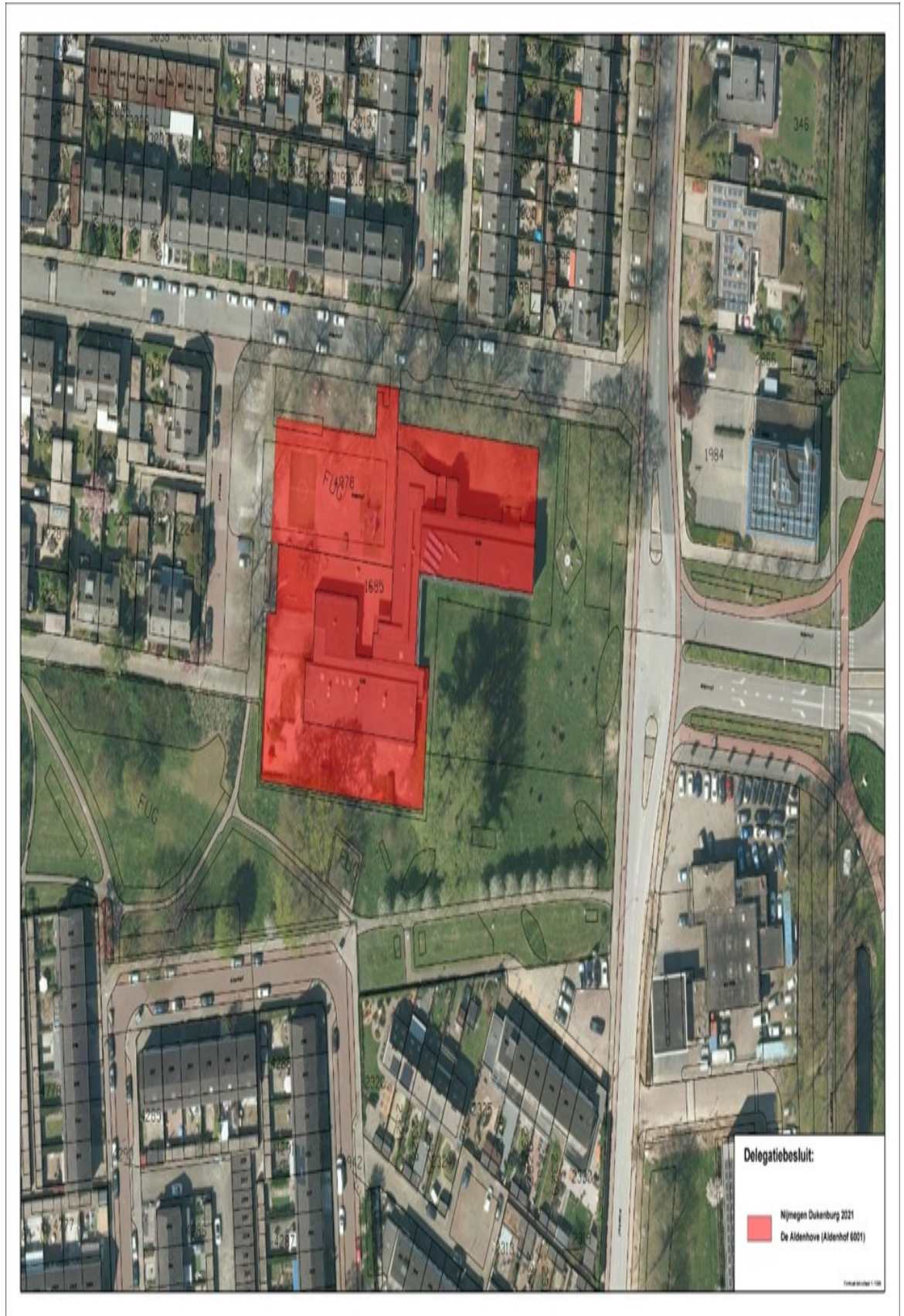
Bijlage 1: overzicht schoollocaties Dukenburg die vallen onder delegatiebesluit