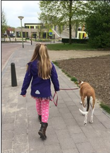
Figuur 1.2 Honden moeten in principe aangeliend zijn in de openbare ruimte van de gemeente Dinkelland.

Deze beleidsnota geeft invulling aan bovenstaande "aangewezen plaatsen" als zijnde hondenlosloopgebieden. Hierbij moet opgemerkt worden dat hiermee de hondenbezitter niet ontzegt wordt van zijn verdere verantwoordelijkheden en verplichtingen jegens zijn hond in de openbare ruimte dan wel binnen deze hondenlosloopgebieden. De eigenaar van de hond is ten allen tijde verantwoordelijk voor het gedrag van zijn hond in de openbare ruimte, zoals de APV voorschrijft in de artikelen 2:57, 2:58, 2:59.