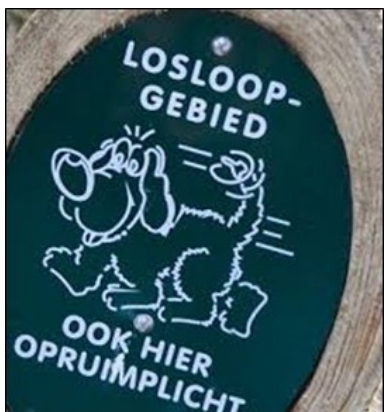
Figuur 3.2 voorbeeld bordje hondenlosloogebied.