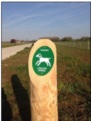
Figuur 4.1 voorbeeld paal met bordje hondenlosloogebied.

het hondenlosloopgebied. Hieronder wordt een voorbeeld gegeven van deze palen met borden. Deze zijn van duurzaam hout en passen goed in de natuurlijke omgeving. Er wordt zowel intern alsook extern gecommuniceerd over het aanwijzen van een hondenlosloopgebied na vaststelling. Denk hierbij aan de website, plaatselijke kranten en sociaal-media.