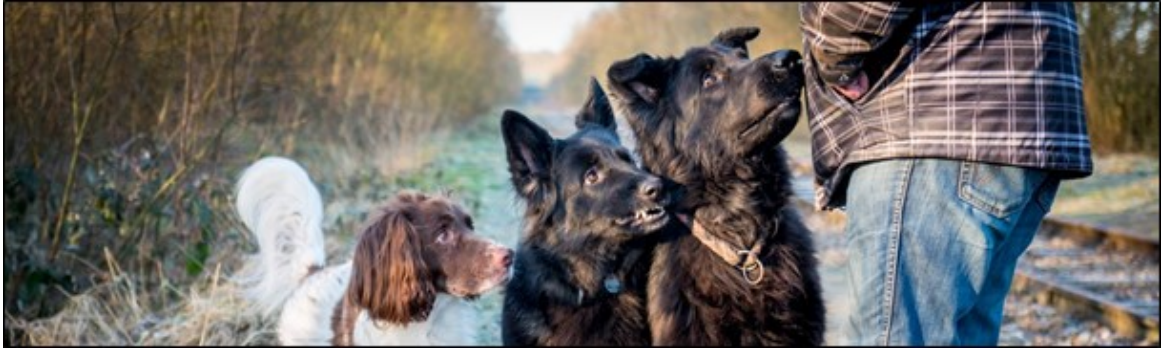
Figuur 2.1 hondenlosloopgebieden is gezond voor zowel dier als mens.