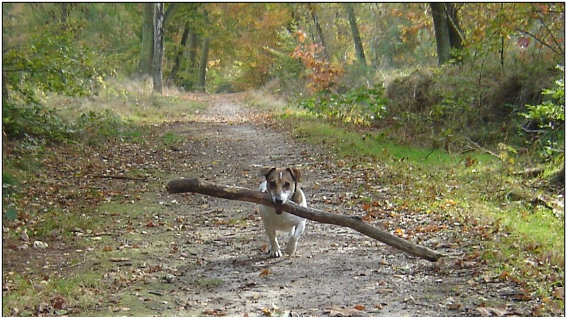
Figuur 3.1 voorbeeld hondenlosloogebied ; langgerekte vorm, rustig gelegen en ingeperkt door natuurlijke barrières.