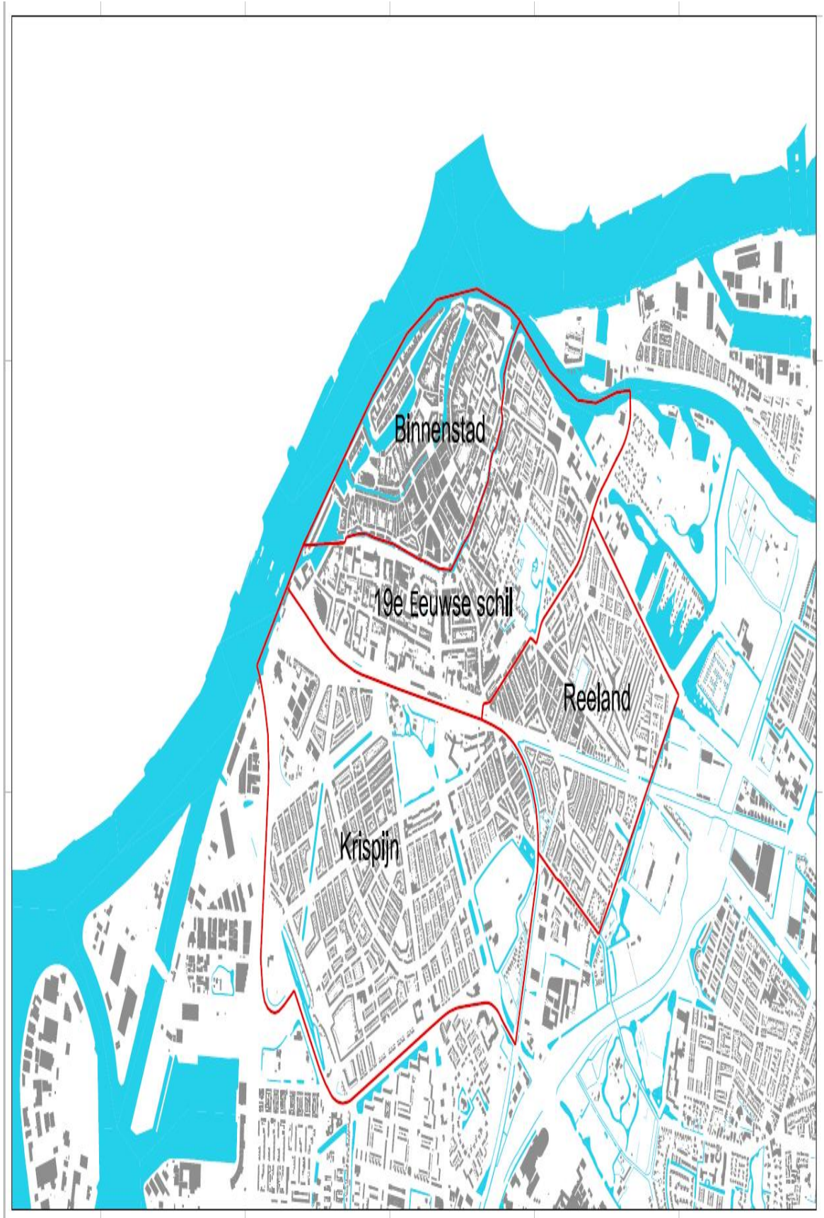
BIJLAGE 2 Situatieschets behorende bij artikel 3.3.5 uit de Huisvestingsverordening gemeente Dordrecht 2019