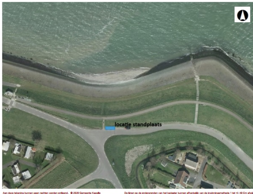
Locatie standplaats Wemeldinge