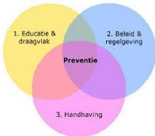
Figuur: Preventiemodel Reynolds (integraal beleidsmodel voor effectief lokaal alcoholbeleid, Reynolds, 2003)

Als uitgangspunt hanteren we, net als de afgelopen jaren, het preventiemodel van Reynolds (2003). De kern van effectief alcoholbeleid ligt in de samenhang tussen een drietal beleidspijlers: regelgeving, educatie en handhaving. Onderstaande figuur maakt het preventiemodel inzichtelijk. In de overlap van de drie pijlers zien we het integrale preventiebeleid terug.