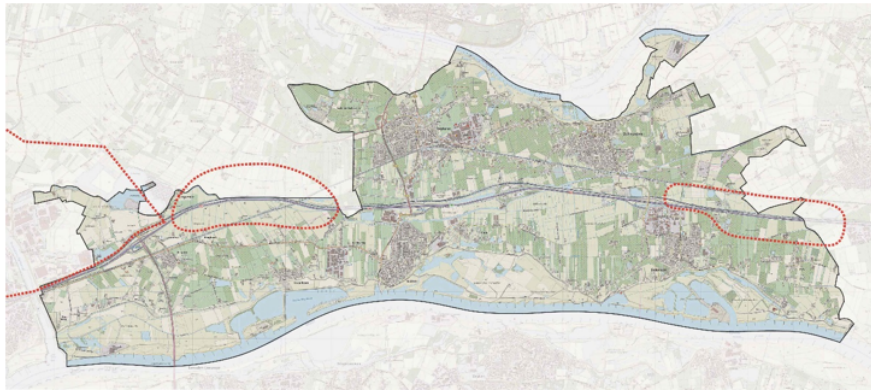
Figuur 1: zoekgebieden zon- en windenergie op land