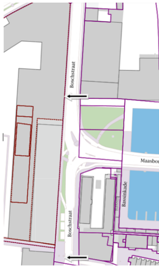
← Aanbiedplaats huishoudelijk afval