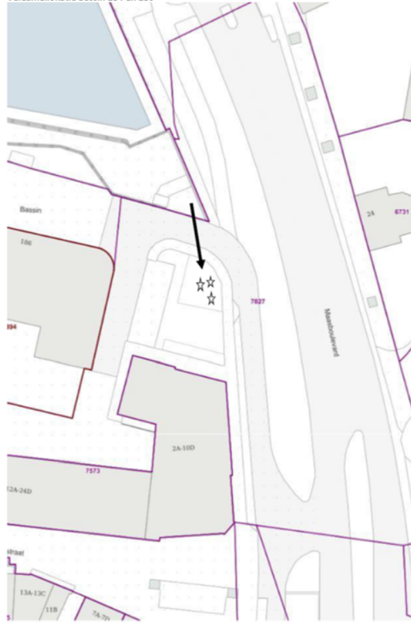
Verzamellocatie Bassin 184 en 186