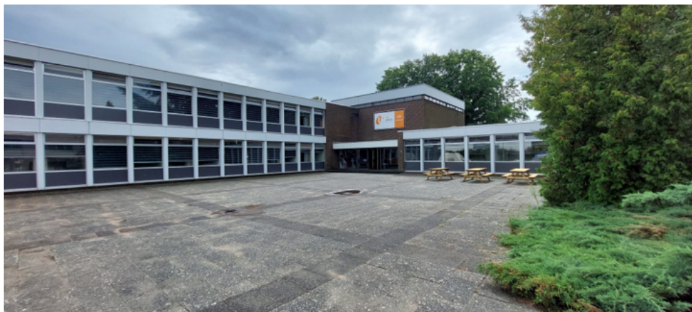
Foto: tijdelijke huisvesting op bedrijventerrein