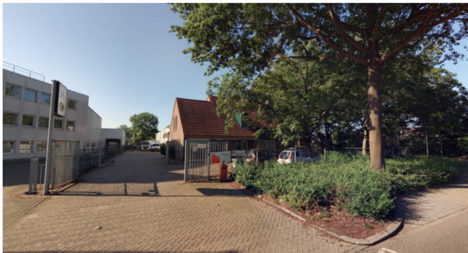
Foto: kamerbewoning bedrijfswoning