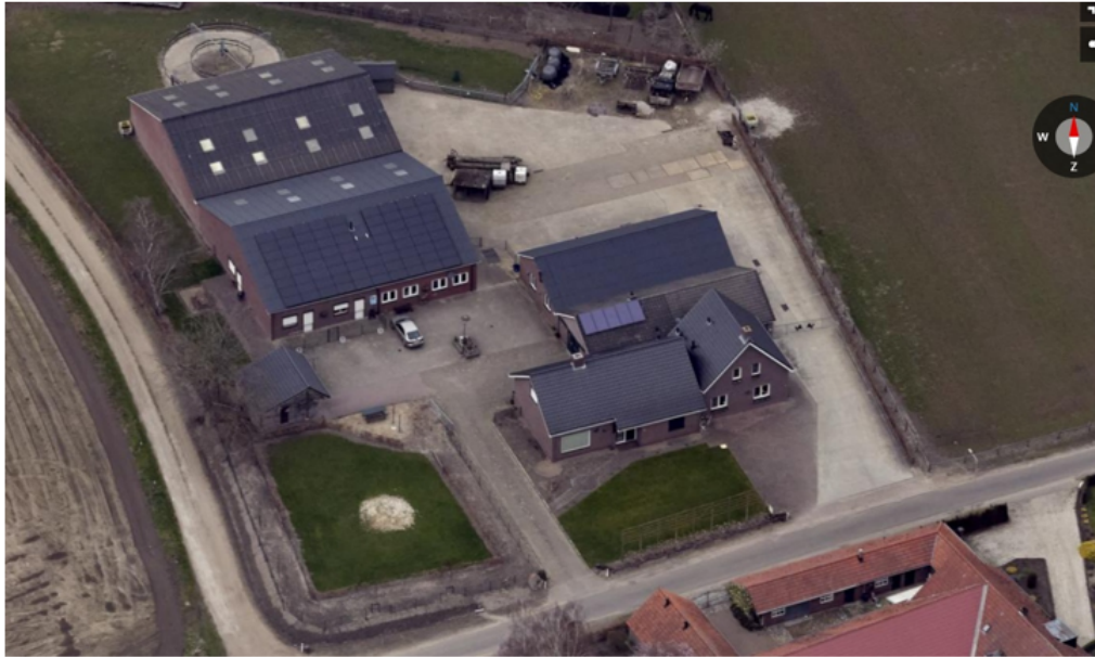
Foto: geclusterde huisvesting op agrarisch bedrijf

Privacy: per kamer mogen maximaal 2 personen worden gehuisvest. Zie ook paragraaf 4.1 tot en met 4.4.