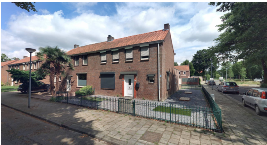
Foto: kamerbewoning reguliere woning

De eerdergenoemde normering is hierop van toepassing. Tevens zijn de onder 4.1 tot en met 4.4 genoemde aspecten aan de orde. Bij een niet-agrarische bedrijfswoning dient aangetoond te worden dat er sprake is van een aanvaardbaar woon- en leefmilieu. Bij een agrarische bedrijfswoning dient tevens de status van plattelandswoning aanwezig te zijn. Deze kan tegelijkertijd met kamerbewoning worden aangevraagd, indien nog niet aanwezig. Er is geen mogelijkheid om meer dan 5 personen in een woning te huisvesten, ook als het een grote woning betreft. Dit in het belang van het behoud van de leefbaarheid in woonbuurten.