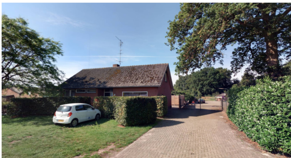
Foto: kamerbewoning agrarische bedrijfswoning (plattelandswoning, geen bedrijf meer actief)