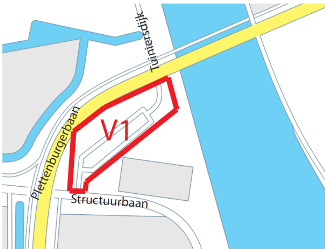
Kaart 2 van 2