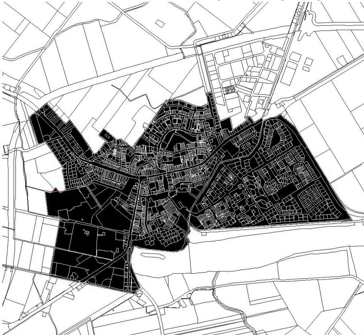
Reclamebelasting Oostburg, kaart deelgebied 1 (Kern)

Overzichtskaarten als bedoeld in artikel 2 van de verordening reclamebelasting Oostburg 2022