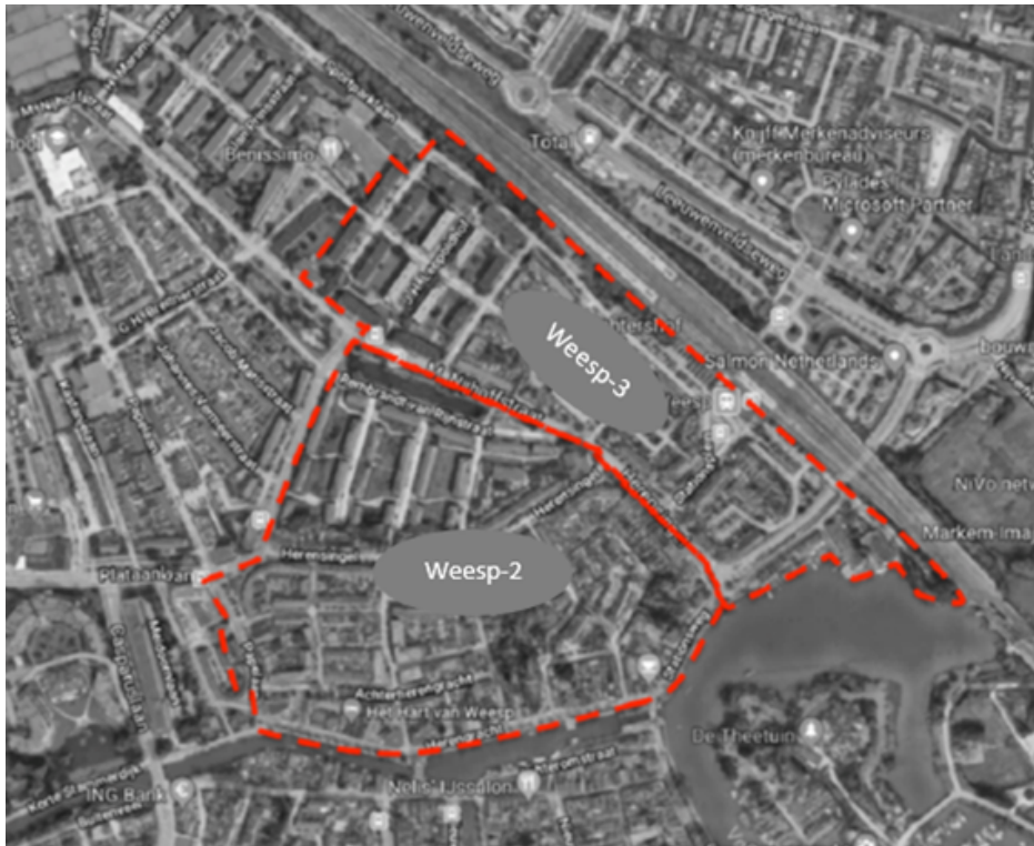
Vergunninggebied Weesp-2 en Weesp-3

Vergunninggebied Weesp-4 , waarvan de grenzen worden gevormd door (1) het westelijke berm van de Lobbrich Boudgerslaan, (2) het midden van het water ten noorden van de Lobbrich Boudgerslaan, (3) het midden van het water ten noorden van het Aartje de Voseiland, (4) de oostelijke berm van de Korte Muiderweg, tot aan de Nijverheidslaan, (5) de noord-westelijke berm van de Korte Muiderweg tussen de Nijverheidslaan en de rotonde Stationsweg (6) het midden van de Stationsweg, (7) het noordelijk spoortalud, (8) het voet- en fietspad tussen Leeuwenveldse weg en het spoortalud (grenzend aan het P+R-terrein, (9) de zuidelijke berm van de Leeuwenveldseweg.