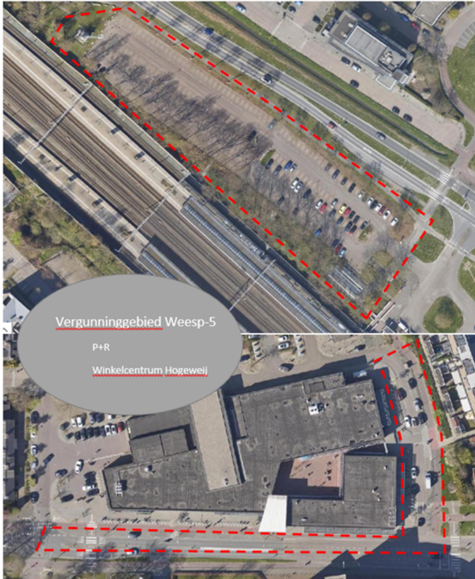
Vergunninggebied Weesp-5 (P+R terrein en omgeving Winkelcentrum Hogewei : Amstellandlaan en Kostverlorenstraat)