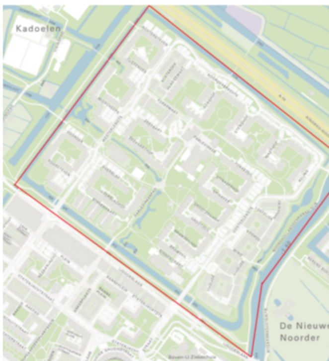
figuur 2 - Detailkaart met daarin het gebied 'Banne Noord' gemarkeerd

De volgende postcodes en bijbehorende huisnummers worden geacht binnen het gebied te liggen: