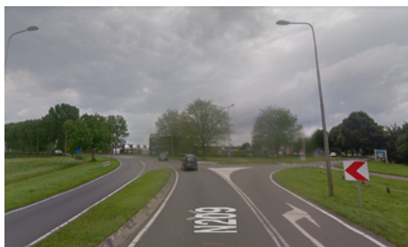
Huidige situatie N209 - Heerewegh

De intensiteit van de ongevallen neemt de laatste jaren weer verder toe.