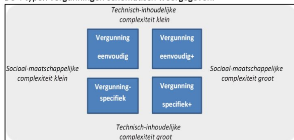
Figuur :Vier typen vergunningen, afhankelijk van de technisch-inhoudelijke en sociaal-maatschappelijke complexiteit van het project, de inrichting of activiteit en/of het gebied waarin de inrichting is gevestigd of de activiteit plaatsvindt.

De 4 typen vergunningen schematisch weergegeven.