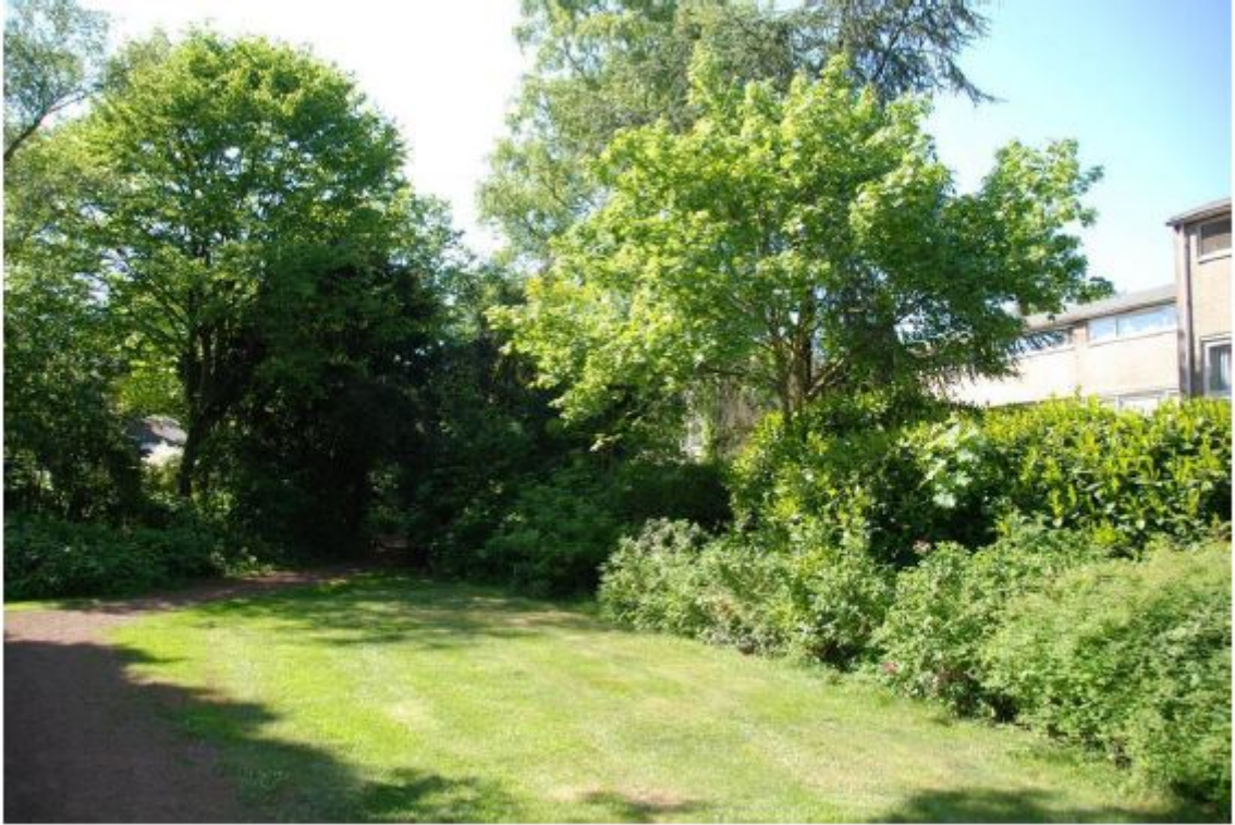
Foto 1. Groene dooradering van wijken