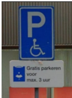
(Bord E06 met onderbord "gratis parkeren voor max. 3 uur")

Plaatsen twee keer bord 'Gehandicaptenparkeerplaats' (bord E06) met het onderbord "gratis parkeren voor max. 3 uur"